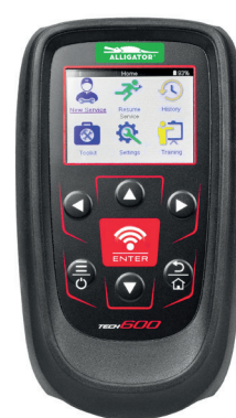
Bartec TECH 600