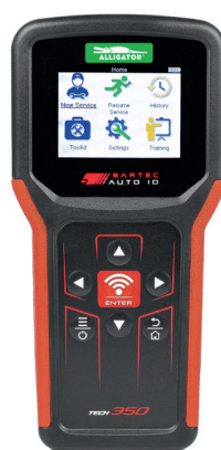
Bartec TECH 350