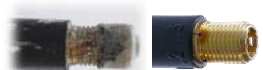
Snap-In Ventil mit starker Korrosion und im Neuzustand.

Aluminium und Messing – vertragen sich nicht ! Die Kombination zwischen Messing und Aluminium führt zu elektrochemischer Korrosion.