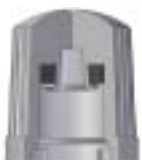
Querschnitt Ventilkappe mit eingebauter Dichtung.