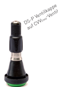
DS-P Ventilkappe auf CVV Easy -Ventil