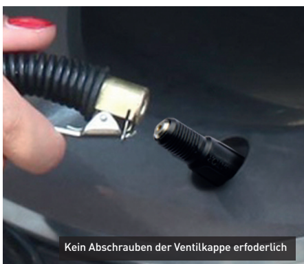
Kein Abschrauben der Ventilkappe erforderlich

In Kombination mit der neuen Ventilkappe DS-P erreicht das CVV31 eine Gesamtlänge von 47 Millimetern. So ermöglicht es eine simple Luftdruckkontrolle sowie -anpassung ohne Abschrauben der Ventilkappe und eignet sich hervorragend für Kleintransporter sowie Wohnmobile.