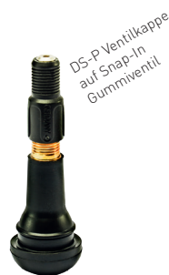
DS-P Ventilkappe auf Snap-In Gummiventil