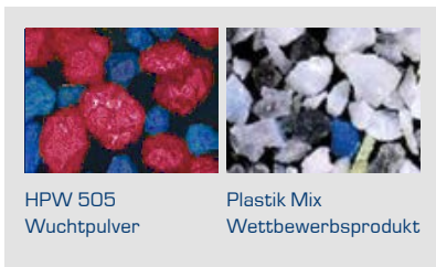
HPW 505 Wuchtpulver

Wir sind der einzige Hersteller in Europa der die volle Bandbreite im Nutzfahrzeugbereich bietet, mit Schlag- und Klebegewichten sowie einer Linie von vibrationsdämpfenden Produkten für die reifeninterne Anwendung.