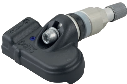
Sensor RS3 Art.-Nr. 590914

gemäß Abdeckungsliste unter www.alligator-ventilfabrik.de