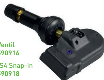
Snap-in Ventil Art.-Nr. 590916

Die Snap-In Variante RS4 kann bei Fahrzeugen eingesetzt werden, die werkseitig bereits mit einer RDKS Gummiventilvariante ausgeliefert wurden und deren bauartbedingte Höchstgeschwindigkeit 210 km/h nicht überschreiten. Sensor und Ventil werden mittels patentierter Clip-Pin Mechanik verbunden, damit wird der Austausch des Ventils bei jedem Reifenwechsel enorm vereinfacht.