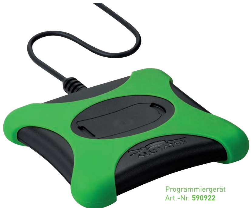
Programmiergerät Art.-Nr. 590922