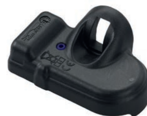
Sensor RS3 Art.-Nr. 590914